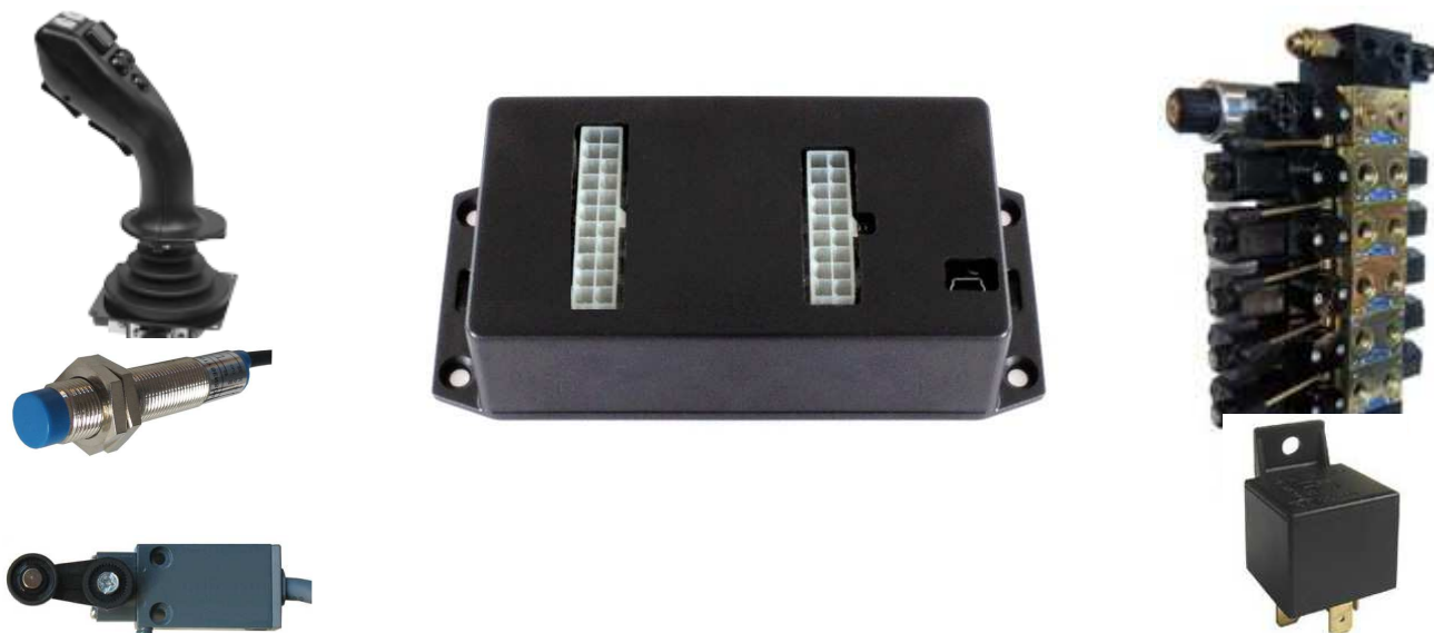
Molteplici possibilità del CanExtender

Microprocessore: 16 bit Frequenza operativa: 24 MHz Memoria Flash 64 Kbyte PL (Performance Level) EN ISO 13849-1: C SIL (Safety Integrity Level) EN 62061: 1 MTBF (Mean Time Between Failures) Siemens SN29500-1 Ground Mobile: 625,08